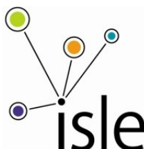
Globalt innovasjonsforum, TAG