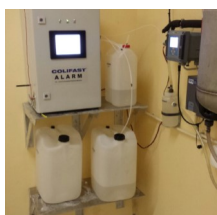
Kvalitet hos vannverk