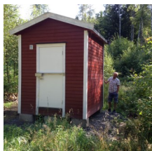
Ny Colifast CALM installert i Oslo