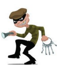
Colifast Felt Kit på avveie